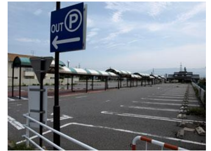
現在、旧西友駐車場に建設中。